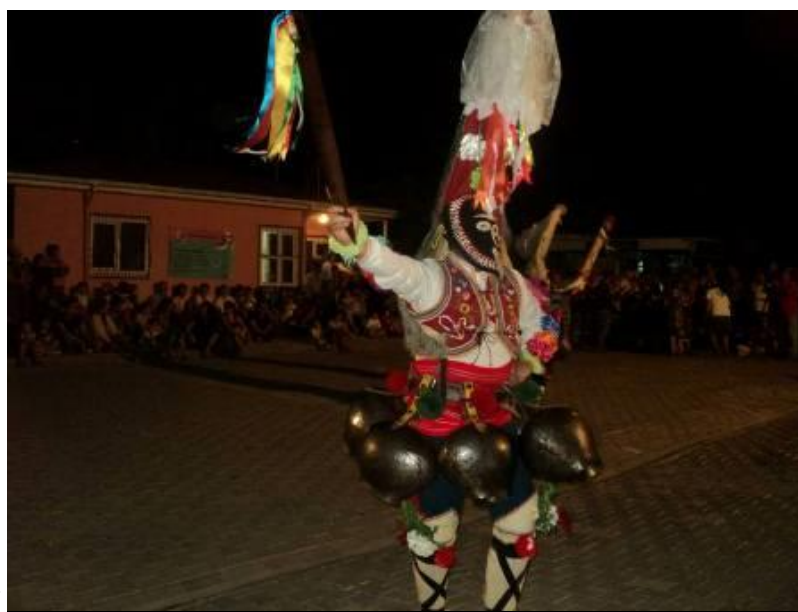
кукерска група „Старци“

Читалище „Иван Вазов - 1881“ с. Долно Сахране