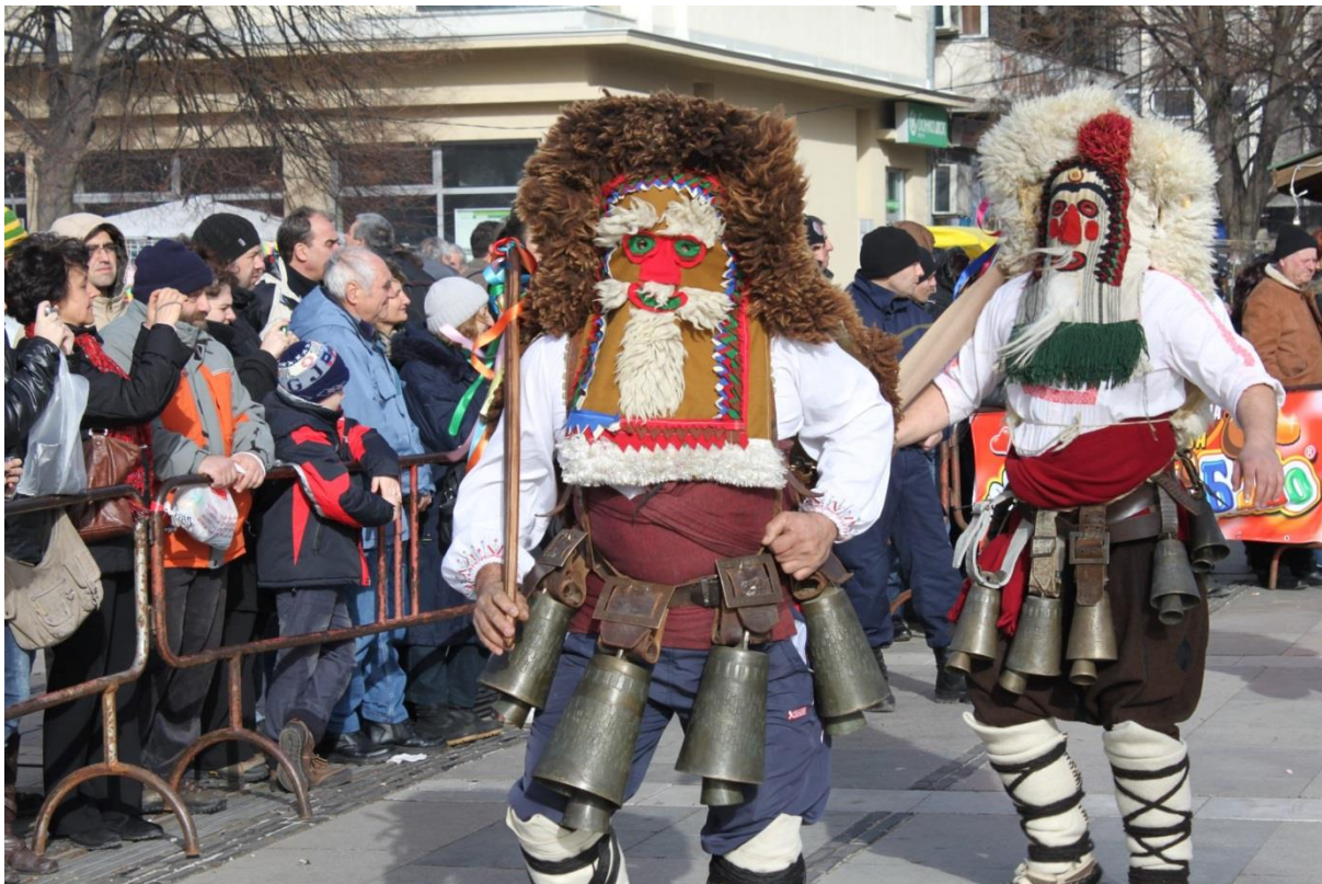
Ансамбъл за песенен фолклор