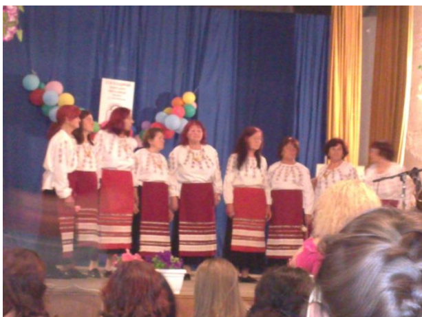
Детският танцов ансамбъл „огърлица“ е награден с грамота.