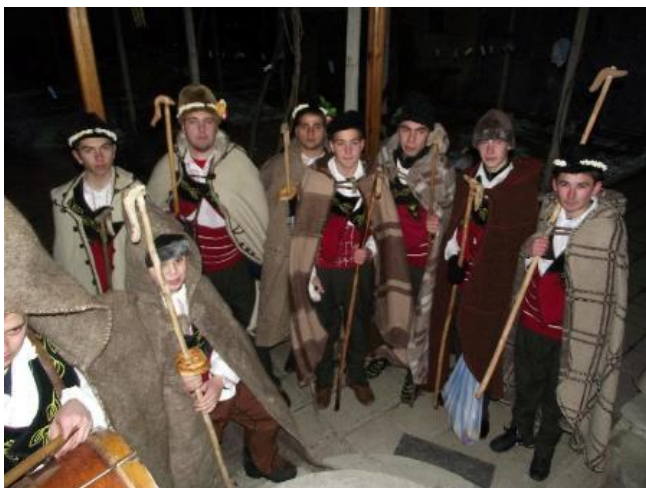
Каракачански танцов състав