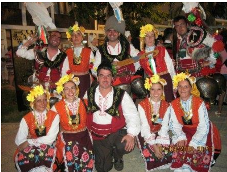
ансамбъл за автентичен и обработен фолклор "сахране" Женска певческа група (народни песни), мъжка коледарска група

През 1905 г. е основано читалището „Светлина“. До 1960 г. то пребивава в различни сгради, докато тогава е решено да се построи собствена, която е завършена през 1965 г. През 1980 г. е наградено с орден "Кирил и методий" I степен за активната си и народополезна дейност. В читалището е изложена Етнографска сбирка, показваща бита на българите през вековете, а библиотеката към читалището притежава 11 000 тома техническа и художествена литература.